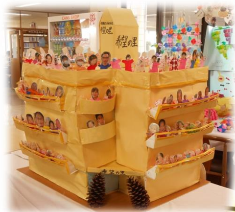
ミニチュア希望の里：2階作品

細かな作業にもかかわらず、皆さん手先が器用ですばらしい作品が勢ぞろいですね♪1階フロアに展示してありますので、どうぞご覧ください。希望の里まで制作してますよ!!